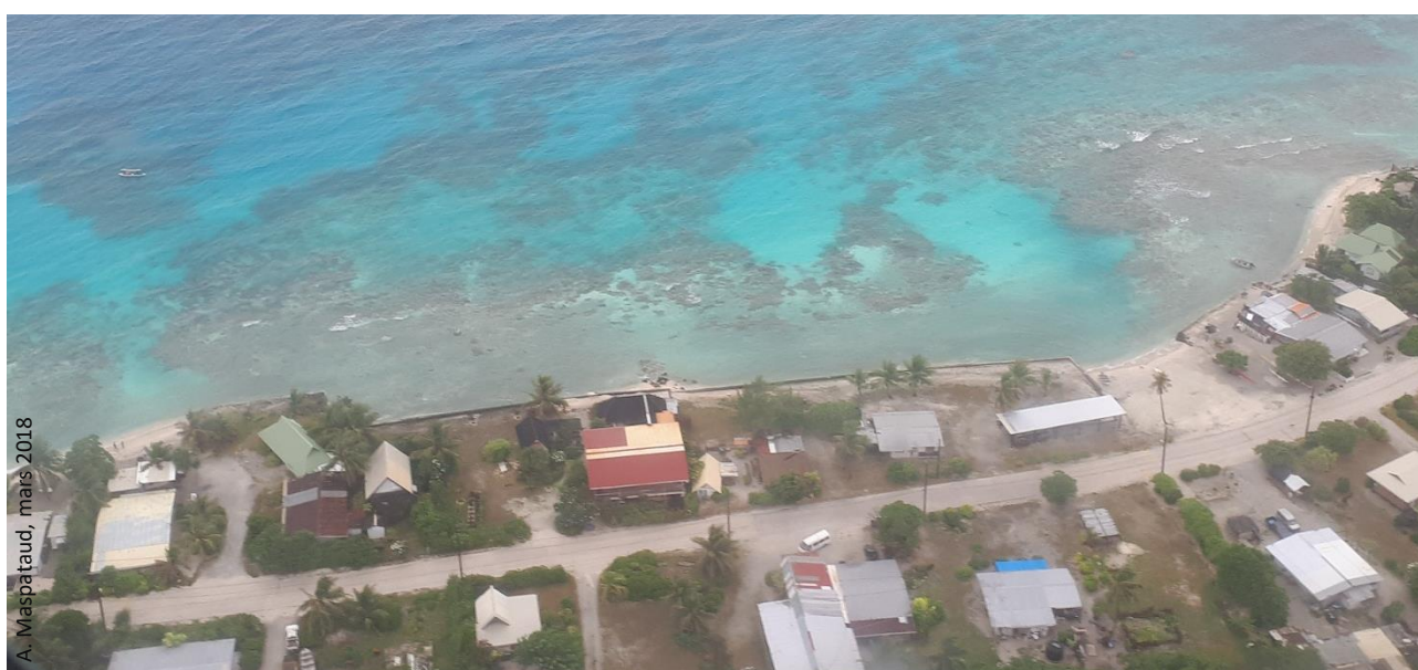
A. Maspataud, mars 2018

Objectif : Ce module permet de rappeler quels sont les grands types d'impacts du changement climatique et en quoi ils exercent une pression sur les systèmes côtiers tropicaux ; et de replacer le rôle du facteur "élévation du niveau de la mer" dans le panel de facteurs en jeu. Il comporte également un volet prospectif. Ainsi, il permet de dresser un bilan de l'état des connaissances et s'appuie sur des exemples variés à l'échelle des îles tropicales pour aborder les SCC développés en Polynésie française dans le cadre d'INSeaPTION.